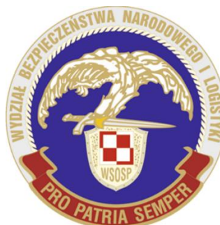
Wydział Bezpieczeństwa Narodowego i Logistyki Wyższej Szkoły Oficerskiej Sił Powietrznych w Dęblinie