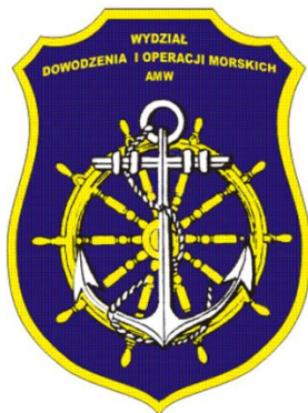
Wydział Dowodzenia i Operacji Morskich Akademii Marynarki Wojennej w Gdyni